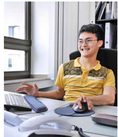
Duy Tan Westphal, Tochtergesellschaft der RWE Deutschland AG, ELE

In Kooperation mit Bildungspartnern führen wir erstmals die verzahnte Ausbildung durch. Im Vorfeld der Ausbildung hatten unsere Auszubildenden den Arbeitsplatz in einem Projekt barrierefrei gestaltet. Der Auszubildende hat einen Ausbildungsvertrag mit dem Berufsbildungs-